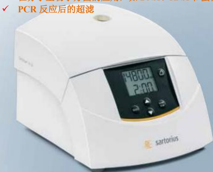
Centrisart A-14 微型离心机